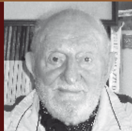
Francesco TOSONI GRADENIGO primario chirurgo, scrittore