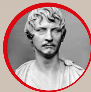
RE LUDWIG I DI BAVIERA