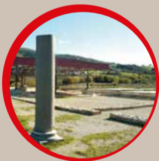
VEDUTA DI SENTINUM