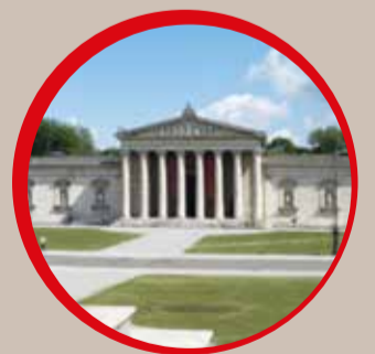
GLIPTOTECA MONACO DI BAVIERA

VENERDÌ 8 GIUGNO 2018 - ORE 17.00 SASSOFERRATO, SALA DEL CONSIGLIO COMUNALE